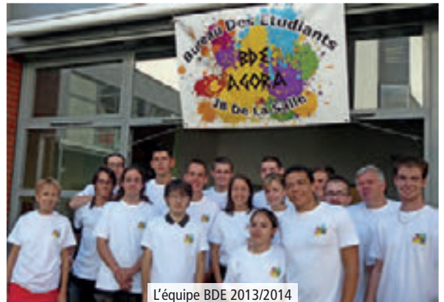
L'équipe BDE 2013/2014